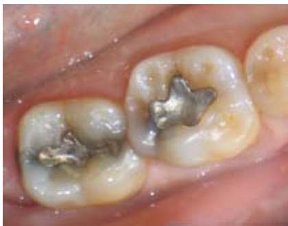
Le mercure métallique, comme celui des amalgames dentaires, va se concentrer dans le système nerveux, surtout au niveau du cerveau.

Lors d'essais en laboratoire, il a été constaté qu'un animal respirant des