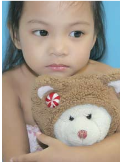
Les enfants autistes sont « absents », dans leur monde, et présentent une certaine indifférence face à diverses stimulations.

Certains auteurs, dont le professeur Andrew Wakefield, de l'école de médecine de Londres, émettent l'hypothèse que le virus de la rougeole issu des vaccins peut perturber la maturation du système immunitaire intestinal chez l'enfant. Ce processus inflammatoire génère des infections dans l'intestin, particulièrement chez les hyperactifs, autistes et épileptiques. Les nœuds lymphatiques de l'intestin deviennent considérablement œdémateux. Les cellules immunitaires s'infiltrèrent alors dans l'intestin. Or la surface des villosités intestinales est tapissée d'enzymes qui digèrent notre nourriture. Si ces enzymes ne fonctionnent pas correctement, comme c'est le cas ici, il y a inflammation intestinale chronique, porte ouverte à la dysbiose (déséquilibre de la flore intestinale pouvant entraîner