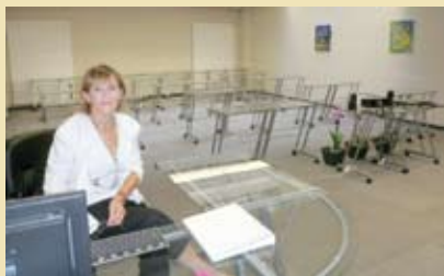
Salle de cours du centre Stélior (Genève).

diplômés reconnus par l'Asca, fondation suisse pour la reconnaissance et le développement des thérapies alternatives et complémentaires, spécialisés en nutrition-détoxicologie. La troisième session débutera dans ses nouveaux locaux début janvier 2011.